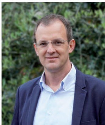
Dott. Filippo Galbiati Sindaco di Casatenovo