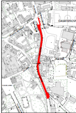
CASATENOVINO CAPOLUOGO 1