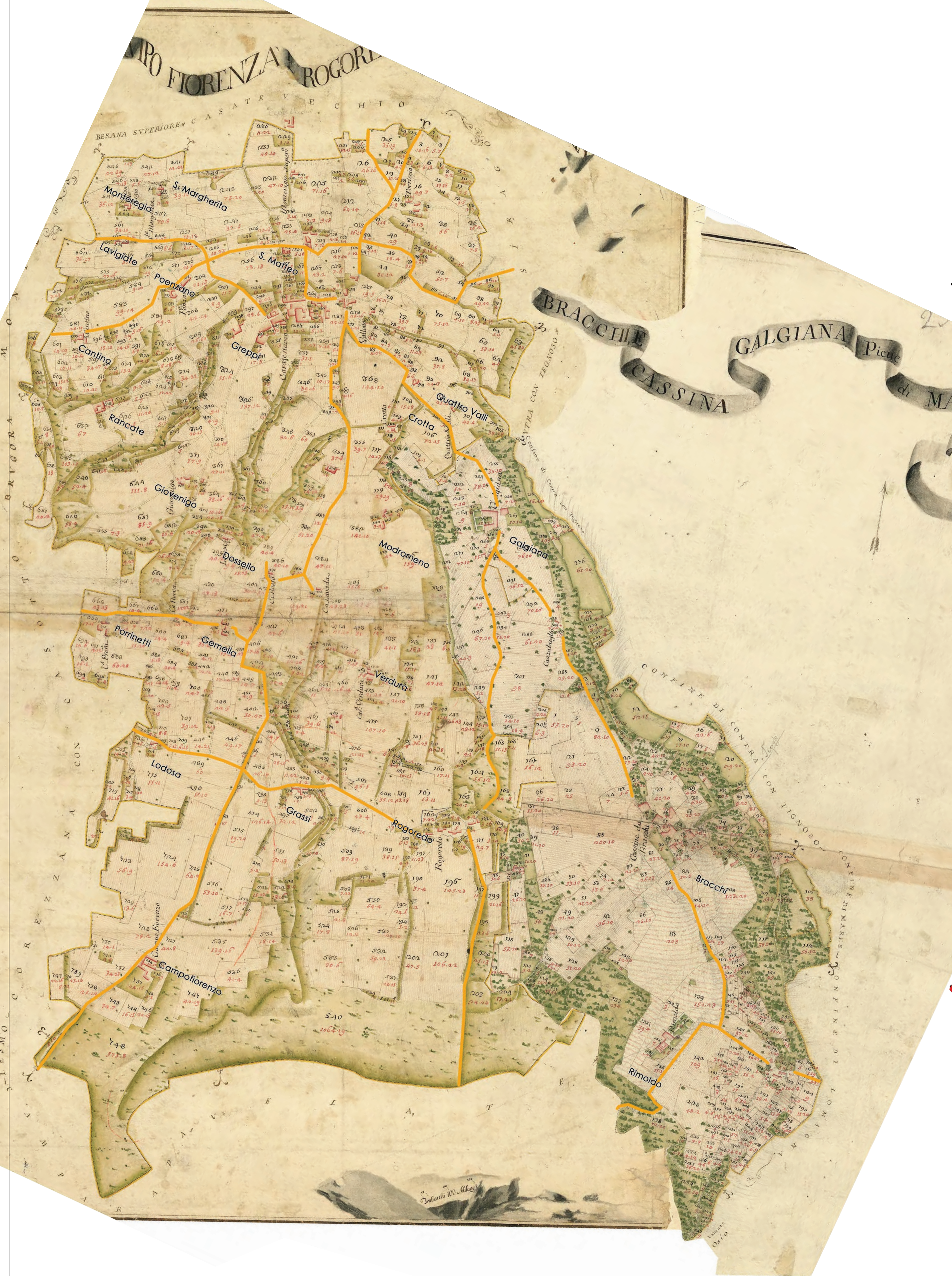
Catasto Teresiano - anno 1750