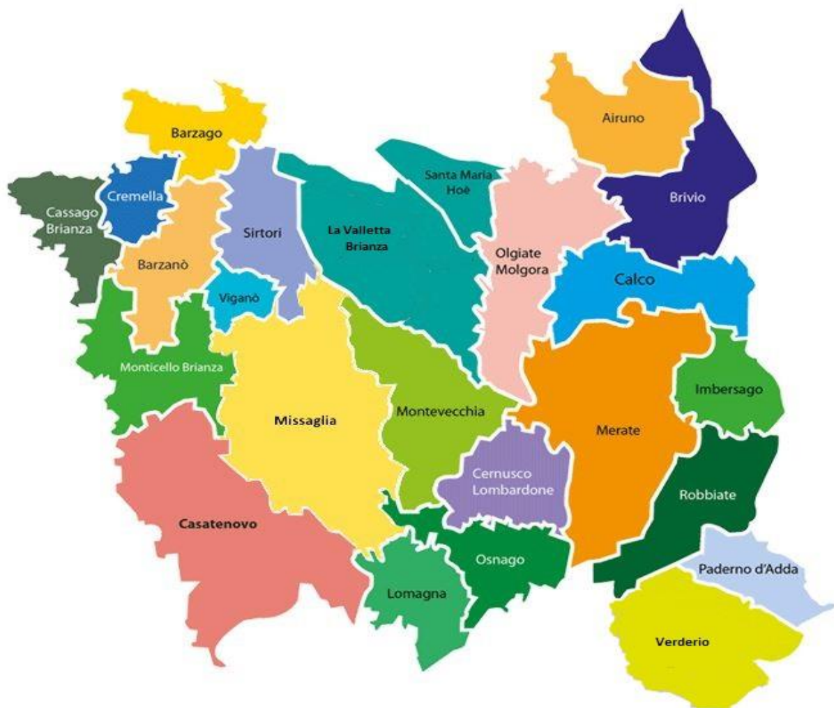
Fig.1 "Ambito di Merate"