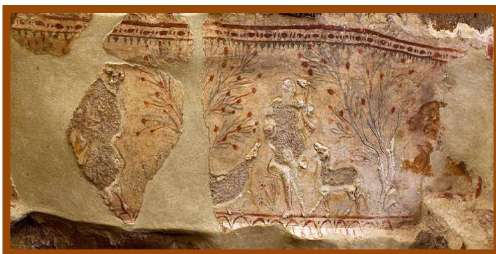
«Catacombe di Priscilla – Roma: Buon Pastore; Maria con il Bambino e il profeta Balaam»