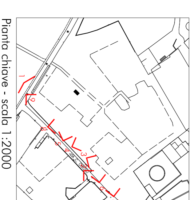
Pianta chiave - scala 1:2000