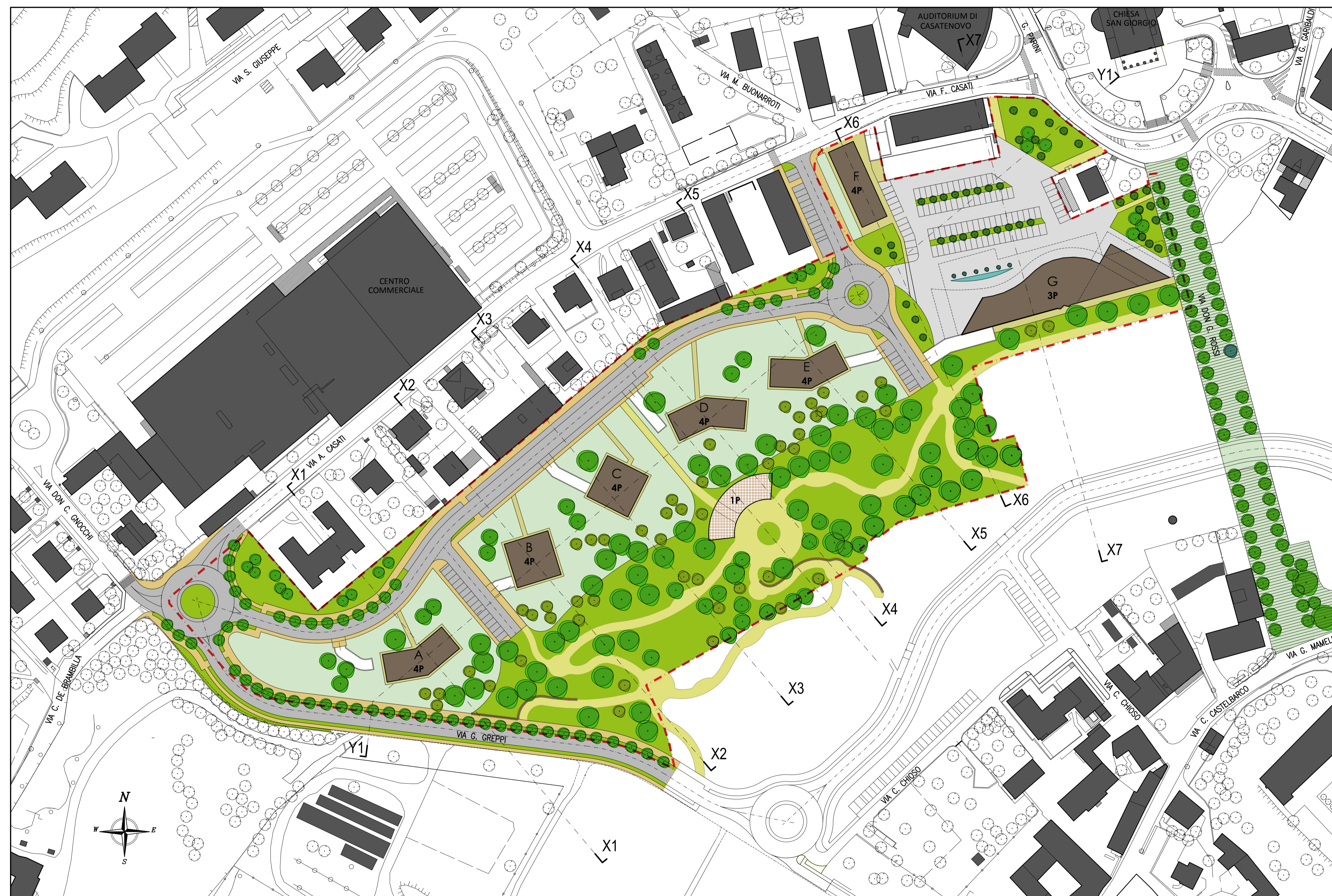
PLANIMETRIA di PROGETTO - r.1:1000