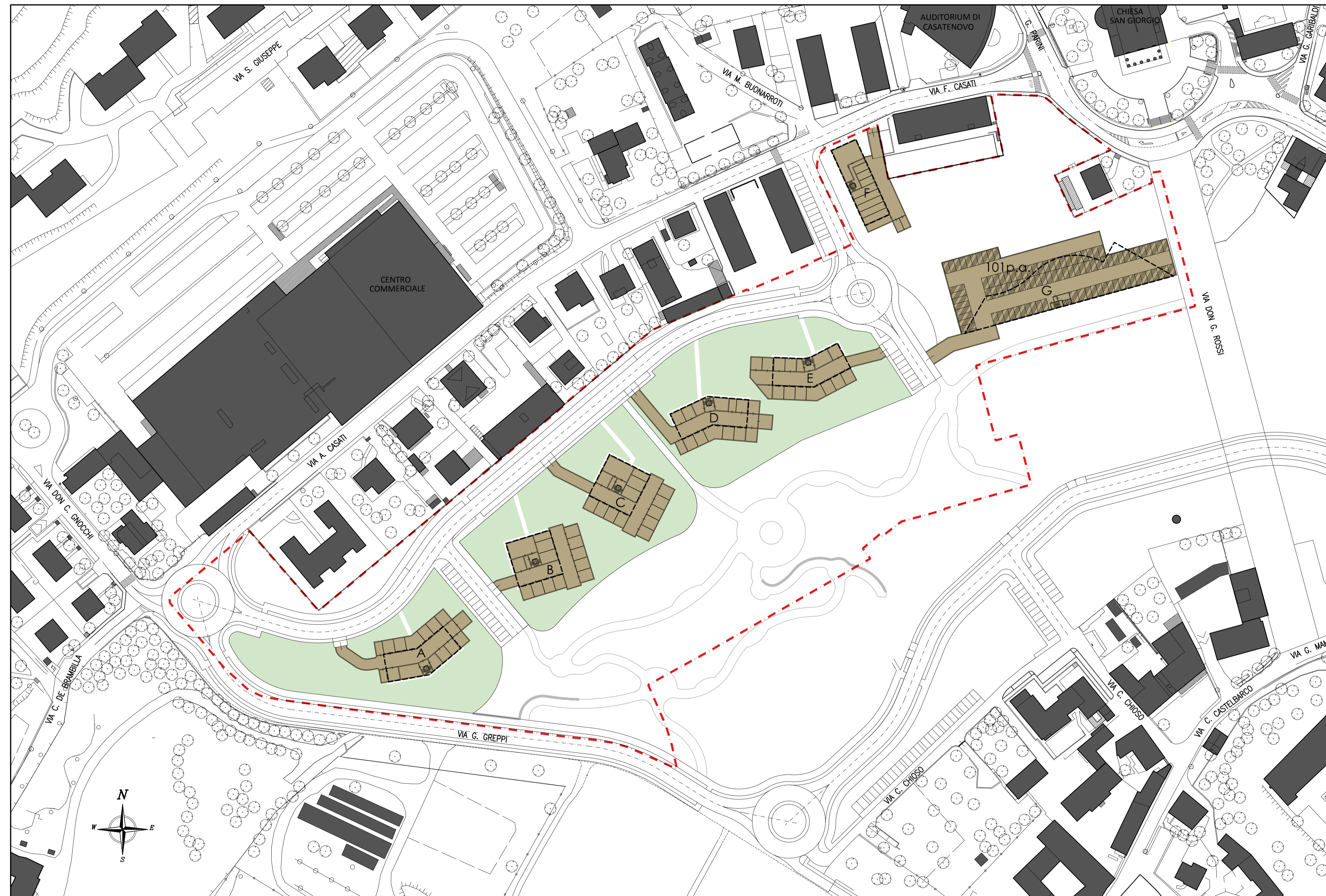
PLANIMETRIA PIANO INTERRATO - r.1:1000