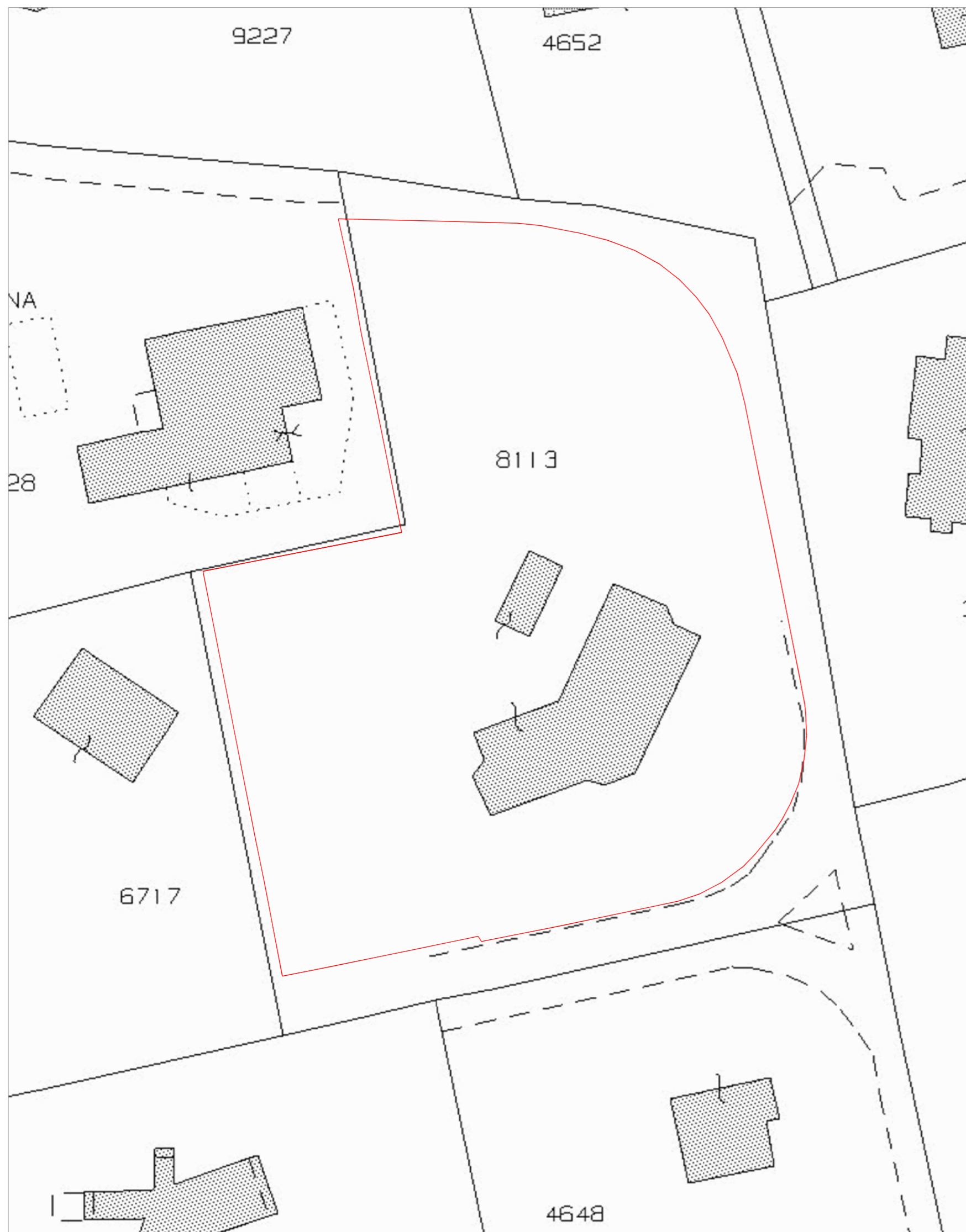
ESTRATTO MAPPA_ FOGLIO 11. 8113 subalterno 701