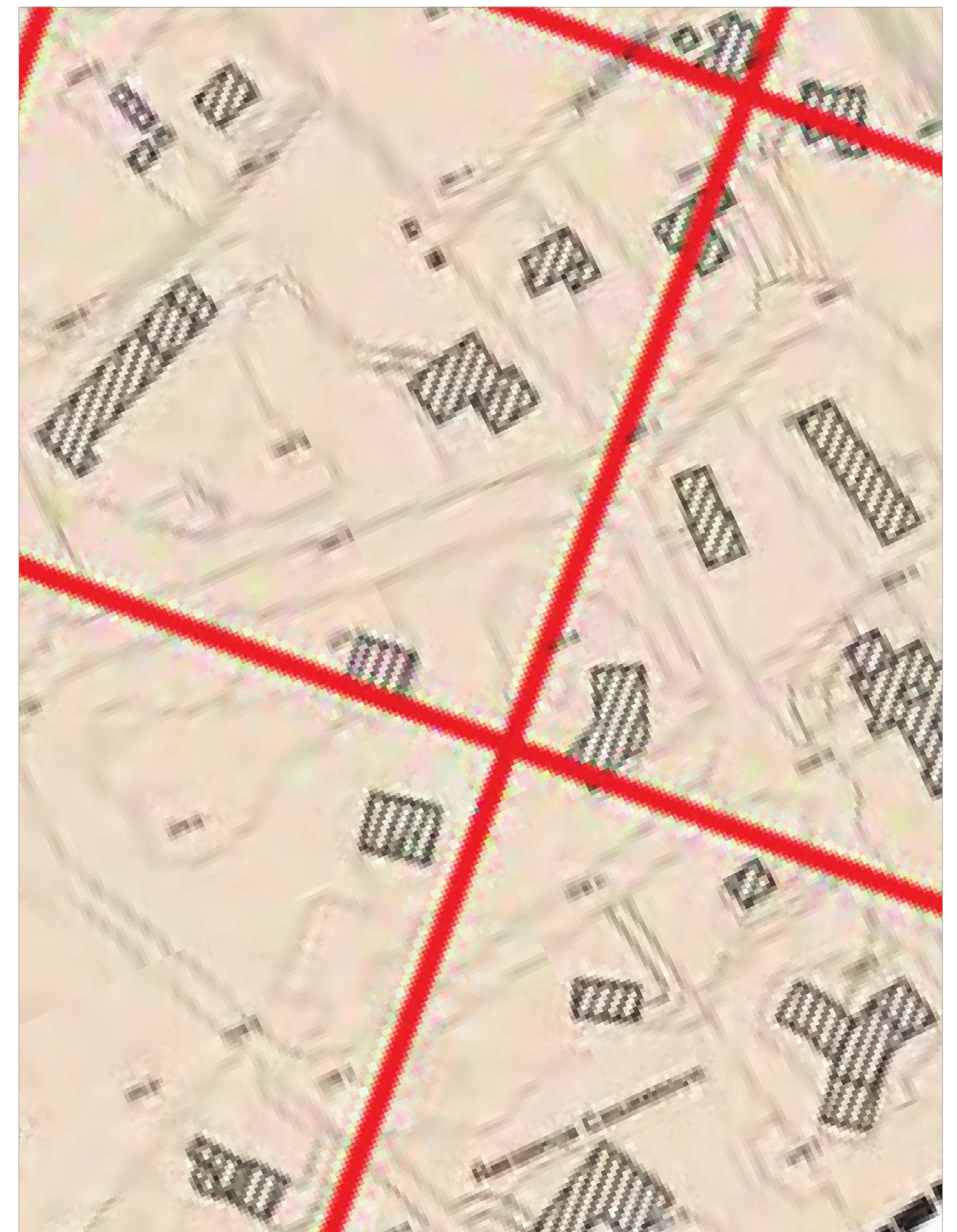
TAVOLA DEI VINCOLI :Classe 3 di fattibilità geologica