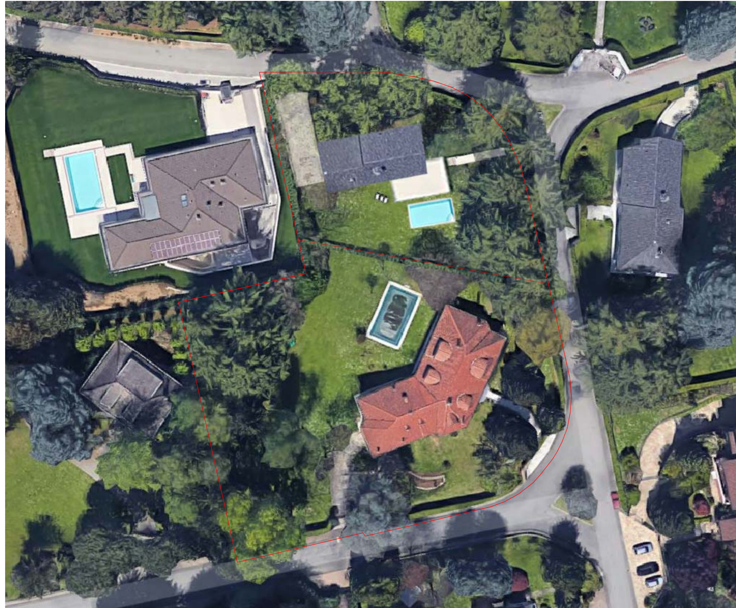
AEROFOTOGRAMMETRICO CON INSERIMENTO DI PROGETTO EDIFICIO RESIDENZIALE MONO-BIFAMILIARE N.2 PIANI FUORI TERRA