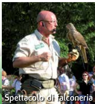
Spettacolo di falconeria