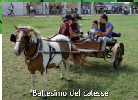
Battesimo del calesse