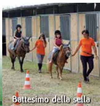
Battesimo della sella