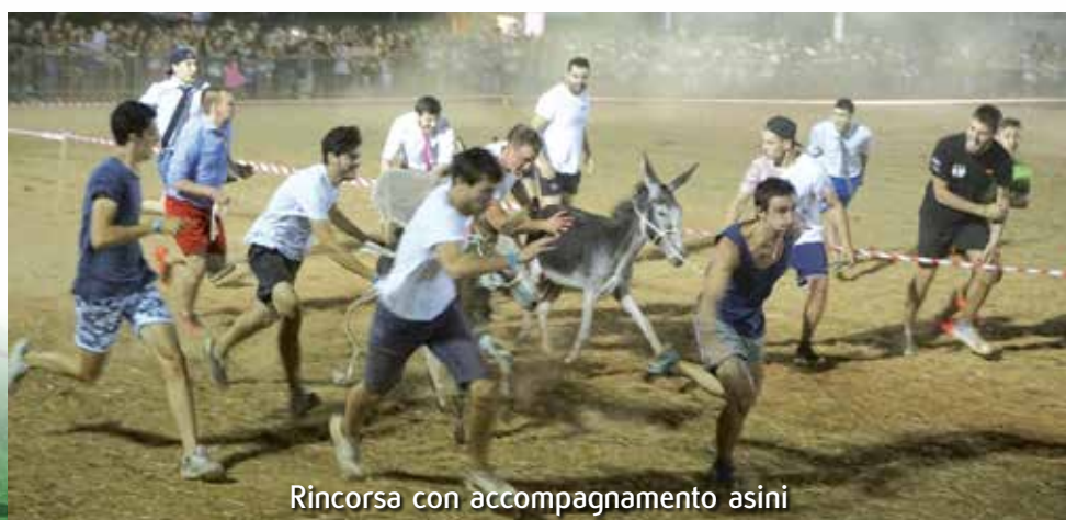
Rincorsa con accompagnamento asini