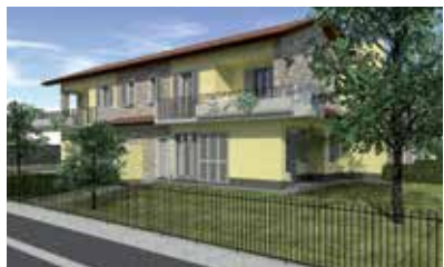
Residenza "I Pini" Loc. Masciocco di Usmate Velate