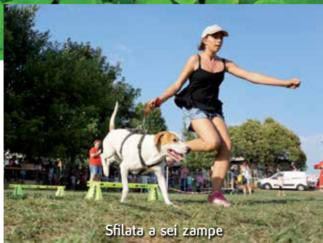
Sfilata a sei zampe