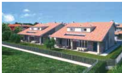
Residenza "Il Sole" Loc. Villanova di Bernareggio

VISITA IL NOSTRO SITO WWW.COSTRUZIONI-SASSELLA.IT