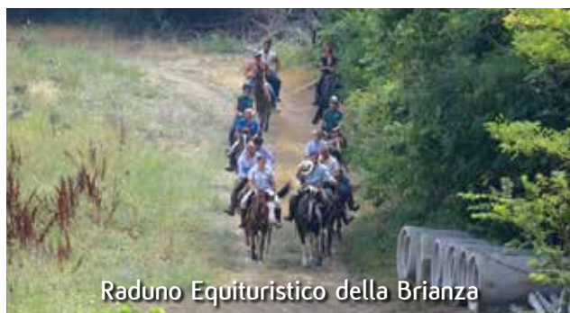
Raduno Equitistico della Brianza