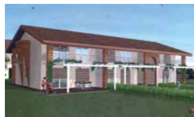
Residenza "Le Colombe" Loc. Rogoredo di Casatenovo