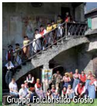
Gruppo Folcloristico Grosio