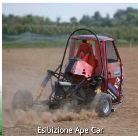
Esibizione Ape Car