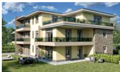
Residenza "Dei Fiori" Loc. Missaglia di Missaglia