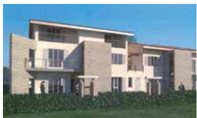
Residenza "Le Rose" Loc. Rogoredo di Casatenovo