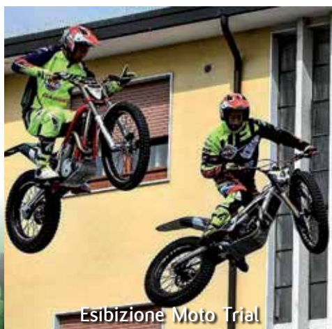
Esibizione Moto Trial