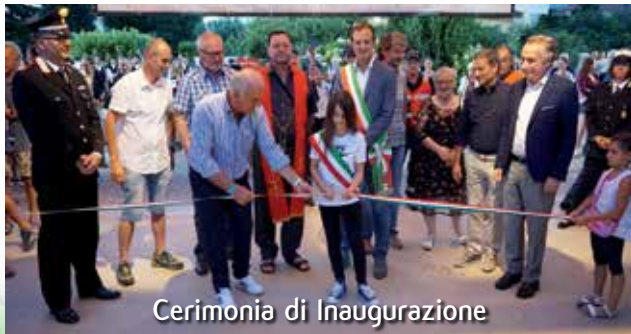
Cerimonia di Inaugurazione