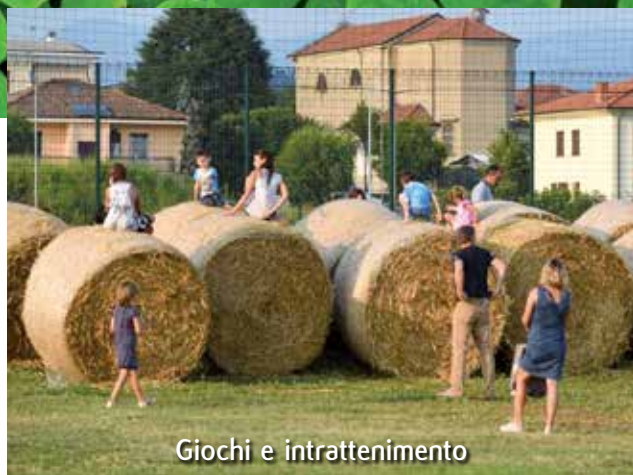
Giochi e intrattenimento