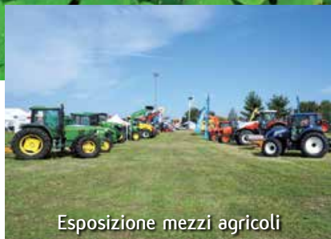
Esposizione mezzi agricoli