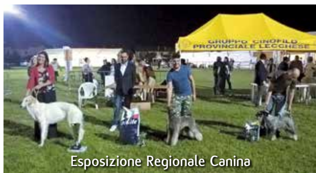
Esposizione Regionale Canina