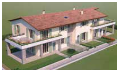
Residenza "Quadrifoglio" Loc. Casatenovo