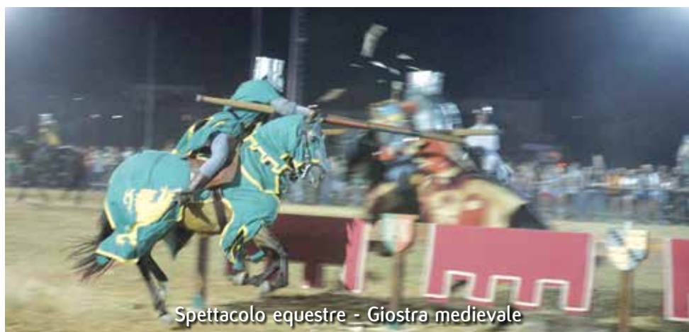
Spettacolo equestre - Giostra medievale