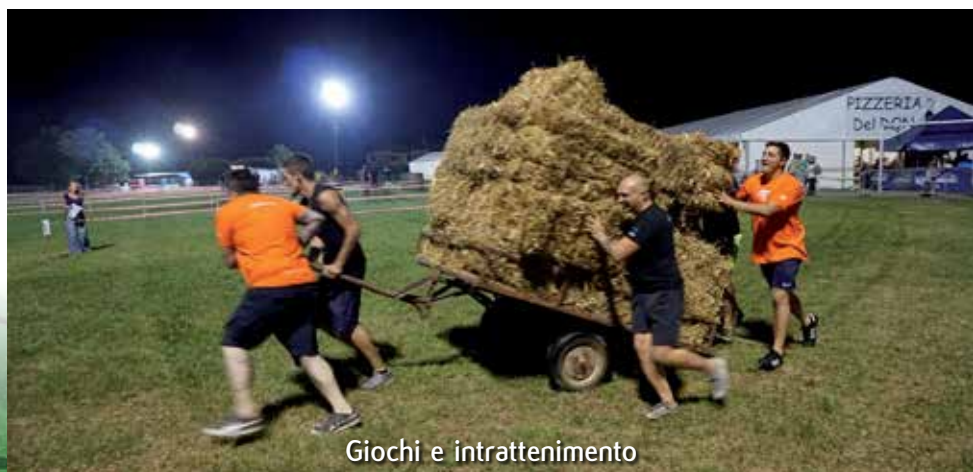
Giochi e intrattenimento